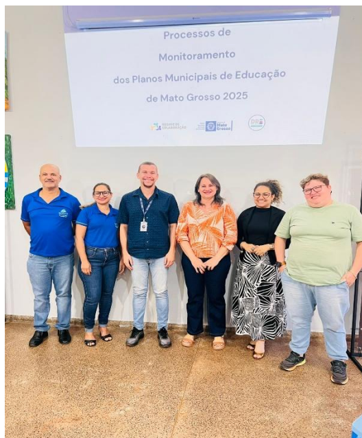
imagem reunião de orientação para elaboração do monitoramento 2023/2024