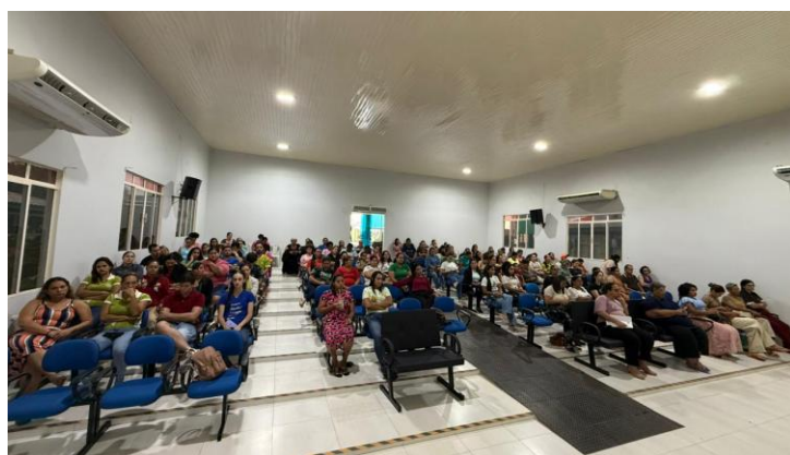
AUDIENCIA PUBLICA PLANO MUNICIPAL DE EDUCAÇÃO 2024/2025