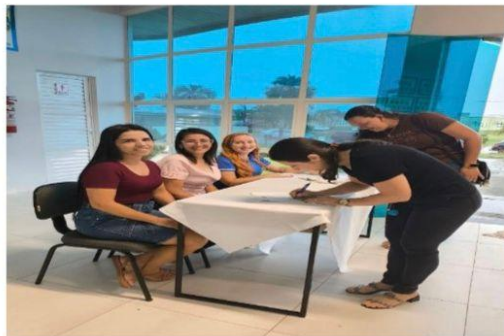
IMAGENS DA AUDIÊNCIA PÚBLICA REALIZADA NO DIA 16 DE DEZEMBRO DE 2025 NA CÂMARA MUNICIPAL DE CLÁUDIA- MT